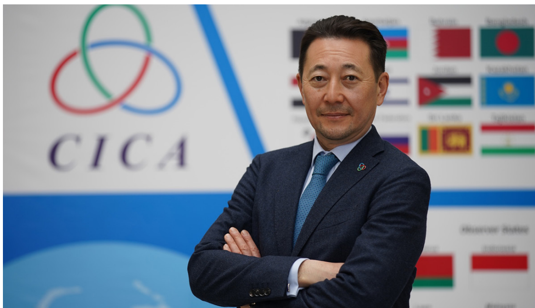
Генеральный секретарь СВМДА Кайрат Сарыбай

В 1992 г. по инициативе Казахстана было создано Совещание по взаимодействию и мерам доверия в Азии (СВМДА). С тех пор прошло более 30 лет, и за это время СВМДА стало важным механизмом диалога в Азии и играет конструктивную роль в укреплении взаимного доверия и сотрудничества между странами. В конце 2023 г. генеральный секретарь Кайрат Сарыбай поделился со СМИ своим видением будущего этого механизма и роли инициативы «Пояс и путь» в глобальном управлении.